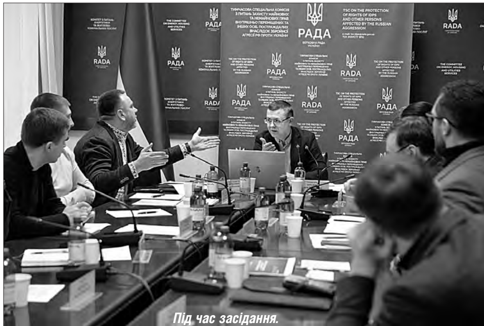
Під час засідання.

— Перше, що зробила після призначення, — від-