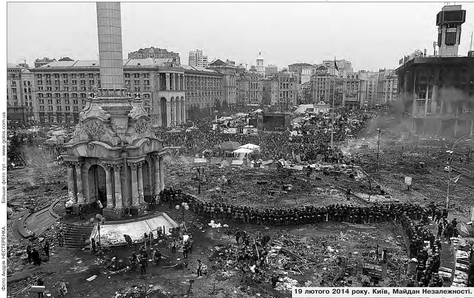
Більше фото тут — www.golos.com.ua

Президент України провів телефонну розмову з Президентом США Джо Байденом. Лідери обговорили поточну ситуацію на полі бою, зокрема обстановку в районі Авдіївки на Донеччині. Співрозмовники наголосили на важливості якнайшвидшого ухвалення Конгресом США законопроекту про додаткове фінансування українських Сил оборони. «Я радий, що можу розраховувати на повну підтримку американського Президента. Віримо й у мудре рішення Конгресу США», — зауважив Глава Української держави. Сторони також відзначили необхідність того, щоб росія понесла повну відповідальність за свої агресивні дії.